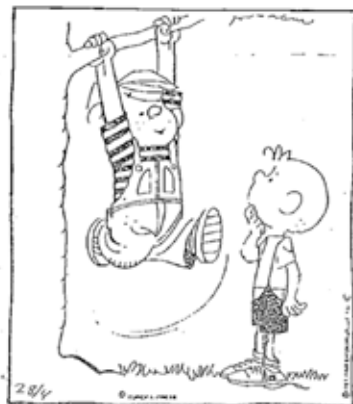
Det bedste du kan gøre er at blive snadder go' til at være DIG.