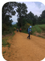
Pilgrimme på vandring

L ivet er en pilgrimsvandring i at lytte til den indre Helligånd og finde sandheden om Gud, og dermed at finde vejen til forening med Kristus i os med hjælp fra Kristus uden for os. Pilgrimsvandringen til Santiago de Compostela repræsenterer en sådan vandring.