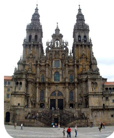
Katedralen i Santiago

minogænge, og når man når til vejs ende er man ked af at det er ovre, selv om man også er lettet og glad for at endelig være nået til målet i Santiago.