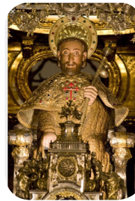
Skt. Jakob over katedralens hovedalter i Santiago de Compostela

ret), er i løbet af de sidste 30 år blevet mere og mere berømt og velbesøgt som Jakobsvejen, hvor det siges, at pilgrimme i tusindtal hvert år går i apostlen Jakobs fodspor. Ifølge bibelen fremgår det, at Jakob tilhørte inderkredsen omkring Jesus, og at han var den første martyr blandt apostlene. Han var for eksempel en af de tre, der var med ved forklarelsen på bjerget, hvor Jesu guddommelige herlighed blev åbenbaret for øjnene af dem.