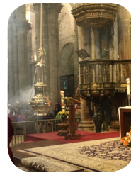
Det store røgelseskar i katedralen

nå dette mål for at bede apostlen om forbøn. Det kan være at det er sandt at det er Jakobs jordiske rester i kisten, men forskere er uenige om det. For mig er det ikke så vigtigt om det er sandt. Det vigtigste er vandringen med Kristus hvor målet i Santiago er symbolet på foreningen med Kristus. At gå i Jakobs fodspor er at gå med Kristus til målet. Livets pilgrimsvandring hjælper os til at blive grundfæstede i en tro der bliver mere og mere personlig og stabil og gradvist smitter af på vort liv.