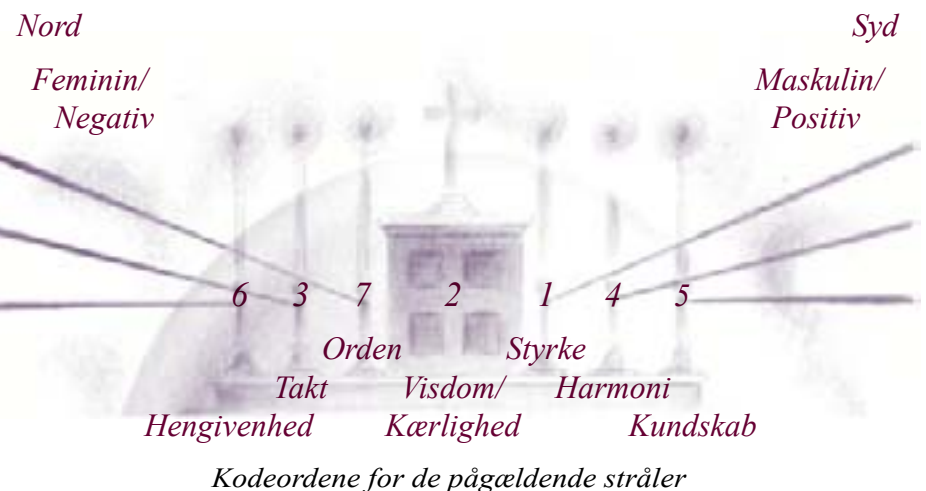
Kodeordene for de pågældende stråler

Til dette punkt kan et eksempel fremhæves. Når vi tænder strålestagerens lys på alteret, så aktiverer vi de gigantiske engle, som varetager disse stråler. Vi forlænger så at sige deres bevidsthed ud i kirkerummet. Det samme gør sig gældende ved de to tilrøgninger og konsekrationen. Ved de to tilrøgninger kan vi være med til at påkalde de syv strålers indflydelse i kirkerummet og i os selv ved en aktiv deltagelse. Dette gør vi blandt andet ved mentalt at nævne, sammen med præsten, kodeordene for de pågældende stråler når strålestagerne bliver tilrøget.