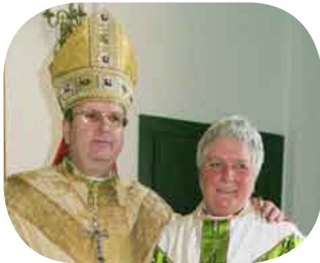
Biskop Evert og Nordens første kvindelige præst

Sønd. 22. oktober Sangmesse, 19. søndag efter Trinitatis